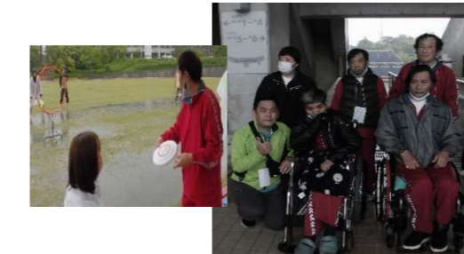
スポーツ大会参加 フライングディスク