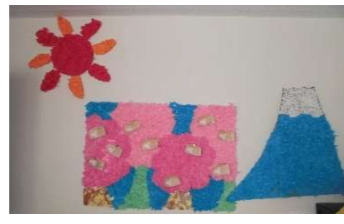
お花紙で作った壁面飾り