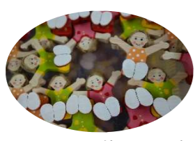
キュートな輪ゴムホルダー