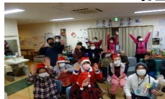
クリスマス親睦会